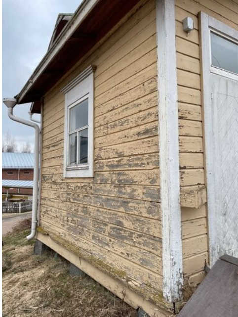
Alkuperäisen osan jälkeen valmistunut lisäosa, maalipinta huonokuntoinen