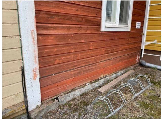
Alkuperäinen osa 1800-luvulta. Hirren pinta ikäännyt, samoin pinnoitus