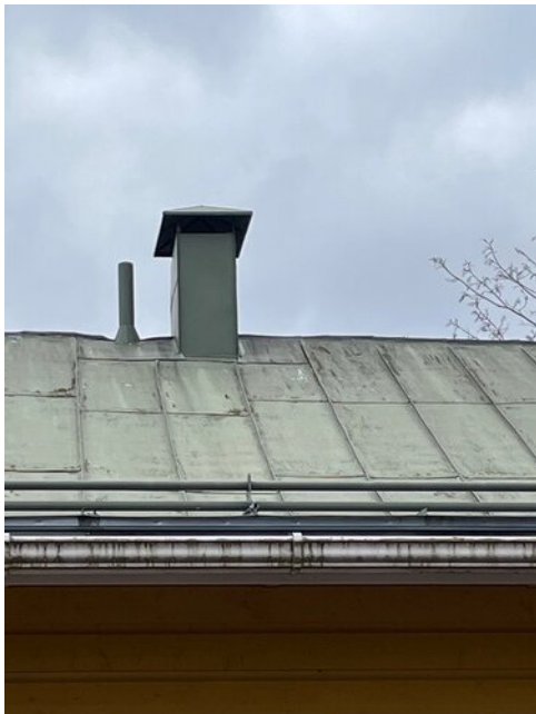
Alkuperäisen osan vesikate on konesaumakate, joka mahdollisesti peräisin 1960-luvulta, mahdollisesti vanhempi. Irtoavat maalit tulisi poistaa ja katto maalata uudelleen