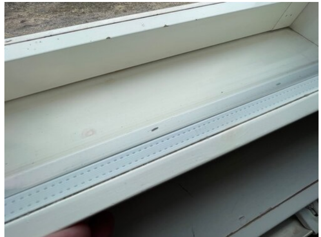
Leiman mukaan valmistettu 1993