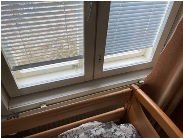
Alkuperäisen osan ikkunat lämpölaselementti- ikkunoita. Osassa ikkunavälejä oli merkkejä lievistä kosteusrasituksesta. Ulkopuitteen paikoin epäsiistit. Ikkunoissa olevat hyttysverkot repsottivat.