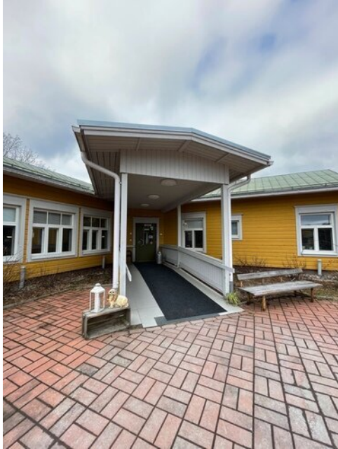
2013 rakennettua laajennusosaa ja rakennuksen pääsisäänkäynti. Ovi suojassa lipan alla.