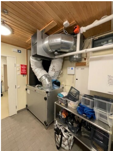
Ilmanvaihtokone ei ole erillisessä tilassa vaan on sijoitettu nurkkaan, jonka kautta asiakkaat kulkevat saunaosastolle