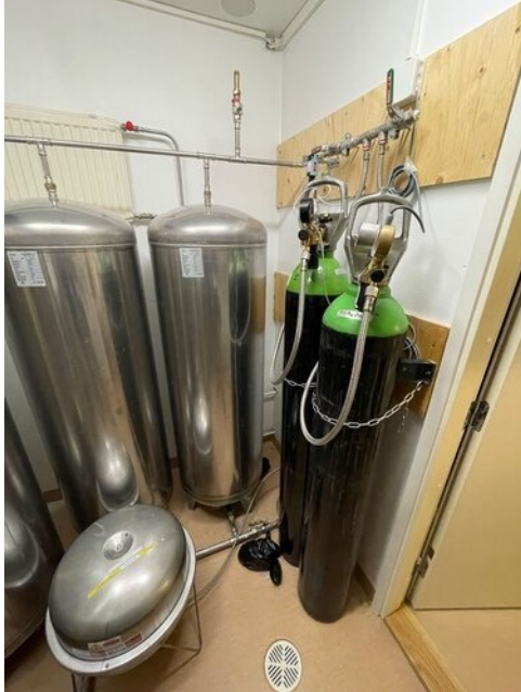
Kiinteistössä on palonsammutusjärjestelmä. Toiminnan varmistamiseksi sammutusvesi varastoidaan 6 x 300l säiliöihin, jossa on 10bar paine.