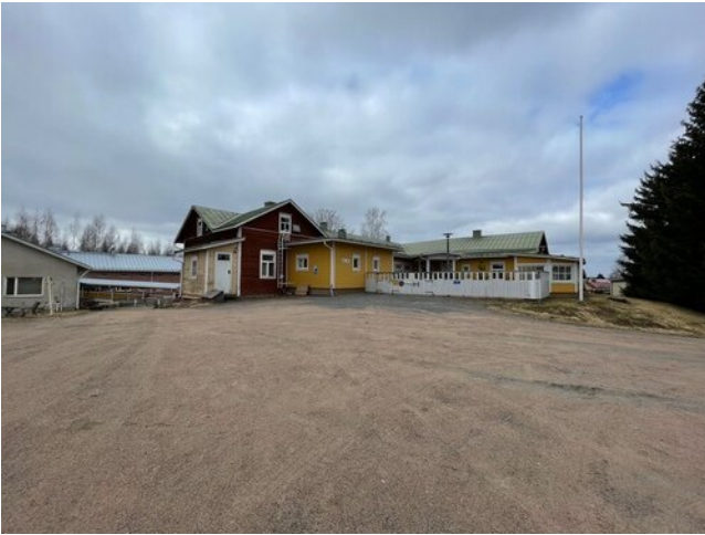
Yleiskuva pihaa-alueesta vieraspysäköinniltä katsottuna. Etualalla näkyy 2013 valmistunut laajennus

Pihaa ei ole asfaltoitu. Pihassa jonkin verran epätasaisuutta pysäköintialueen ja portin välissä. Invapysäköinti portin vieressä